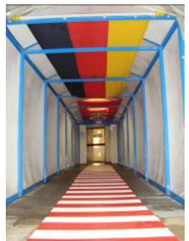
Tragflughalle Schwimmbad Mainzer Schwimmverein gGmbH